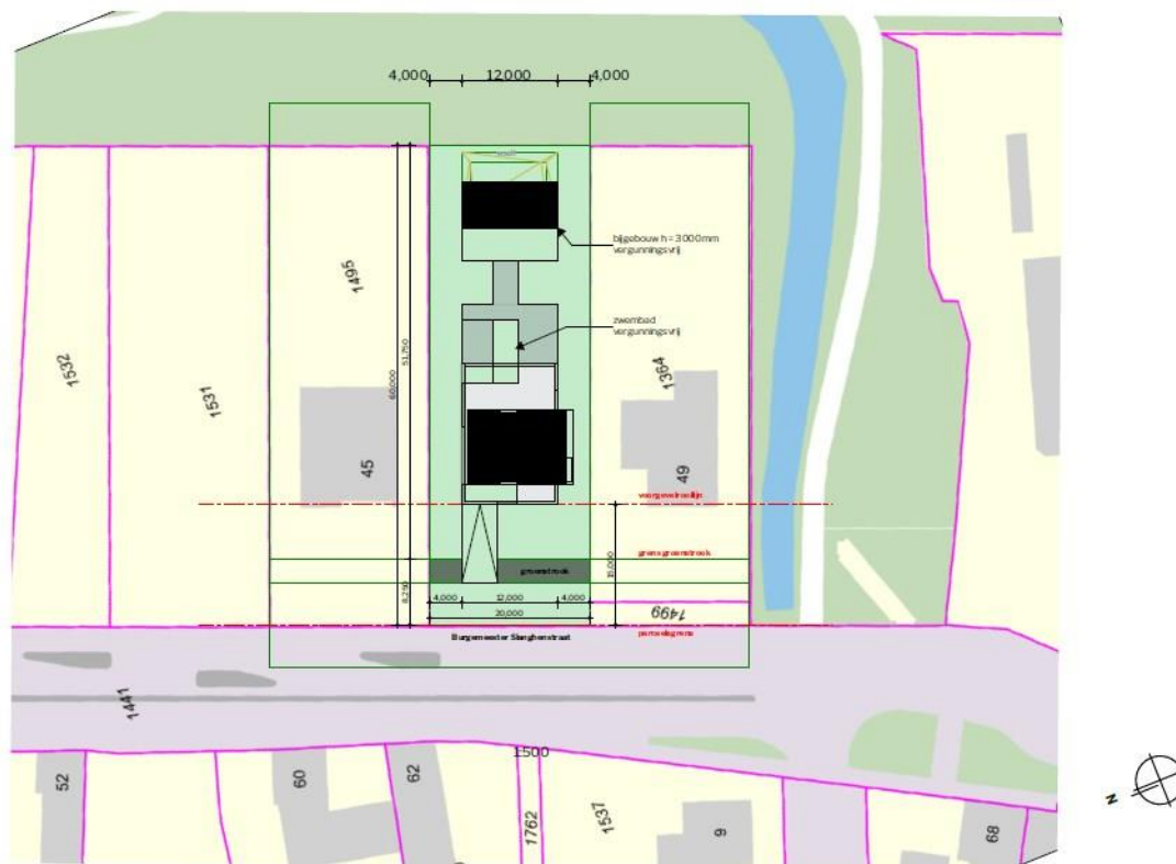
Woonhuis Burgemeester Slaghenstraat | Burgemeester Slaghenstraat Hoensbroek | 29.11.2022 | VO-03 situatietekening